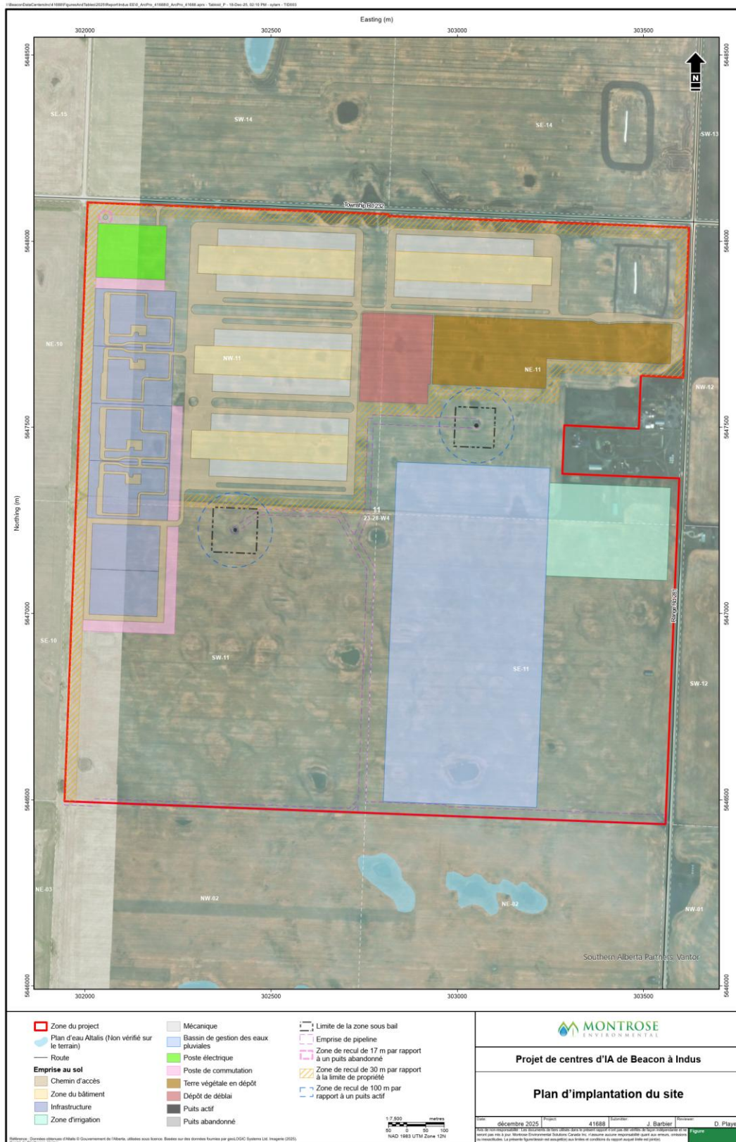
Figure 1.3.2 Site du projet