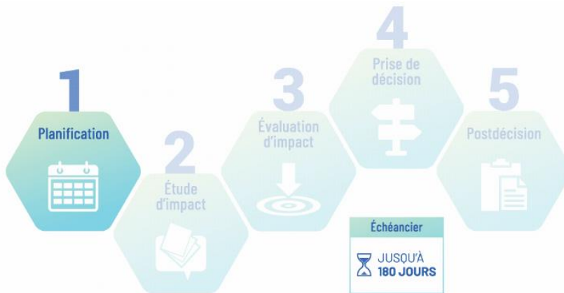
Figure 2 : Étape préparatoire dans le cadre du processus d'évaluation d'impact

L' étape préparatoire pour l'évaluation d'impact du projet a pris fin le 18 août 2025. Cette étape est la première des cinq étapes du processus fédéral d'évaluation d'impact en vertu de la Loi sur l'évaluation d'impact (figure 2). L'étape préparatoire permet de cibler les enjeux clés liés au projet, de décider si une évaluation d'impact est requise, de comprendre comment les groupes autochtones et le public souhaitent participer au processus d'étude d'impact et de planifier l'évaluation.