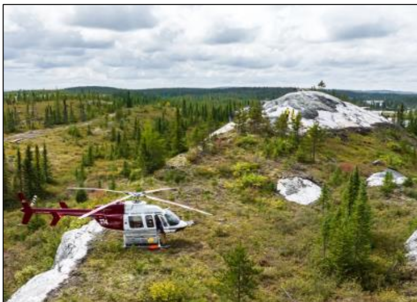
Figure 1 : Exploitation à ciel ouvert de la pegmatite à spodumène - Shaakichiwaanaan