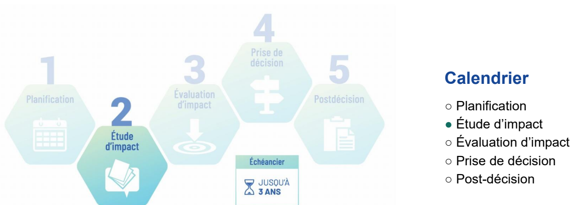
Figure 3 : Étape de l'étude d'impact dans le cadre du processus d'évaluation d'impact