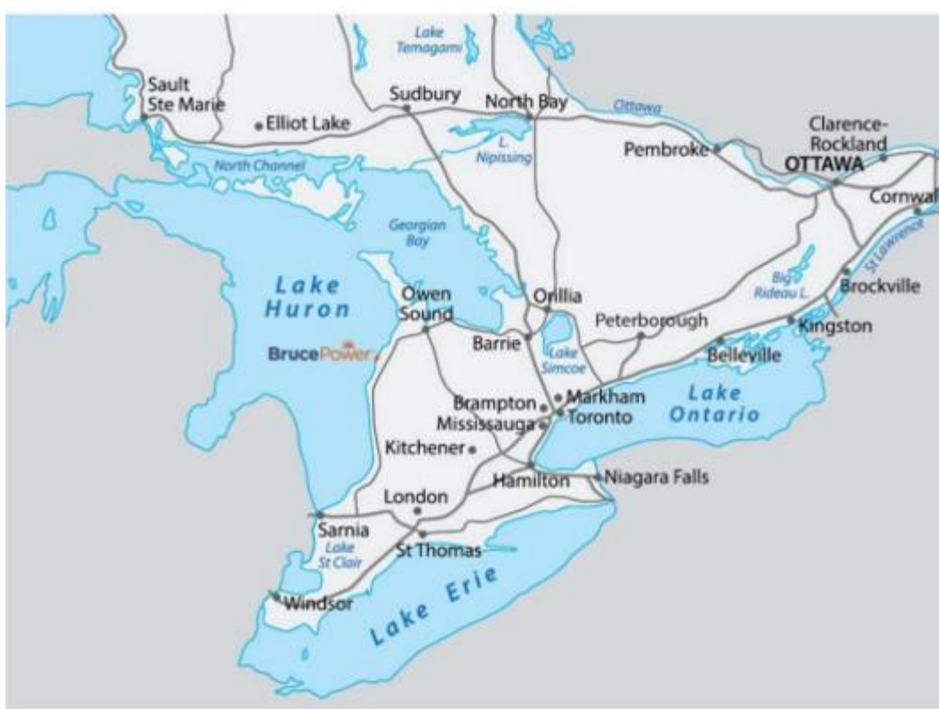
Figure 1 : Plan du projet

Pour obtenir de plus amples renseignements sur le Projet de centrale nucléaire Bruce C ou pour consulter les renseignements et les commentaires reçus, consultez le Registre canadien d'évaluation d'impact (le Registre) à la page du Projet de centrale nucléaire Bruce C .