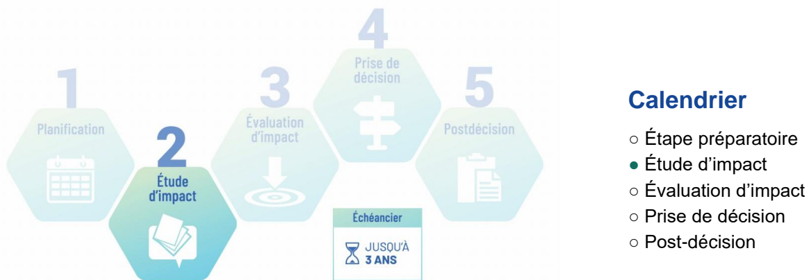
Figure 3 : Étape de l'étude d'impact dans le cadre du processus d'évaluation d'impact