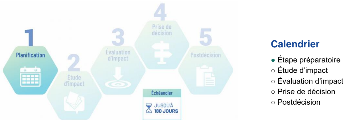
Figure 2 : Étape préparatoire dans le cadre du processus d'évaluation d'impact