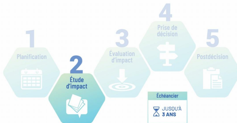
Figure 3 : Étape de l'étude d'impact dans le cadre du processus d'évaluation d'impact

Le 8 novembre 2024, l'AEIC a émis l' avis du début d'une évaluation d'impact pour le projet et a fourni au promoteur les versions finales des lignes directrices conjointes relatives à l'étude d'impact et des plans. Dans le cadre de l'évaluation d'impact du projet, l'AEIC a ensuite entamé l' étape de l'étude d'impact (figure 3), au cours de laquelle le promoteur recueillera des renseignements et mènera des études telles que décrites dans les lignes directrices conjointes relatives à l'étude d'impact afin de préparer une étude d'impact.