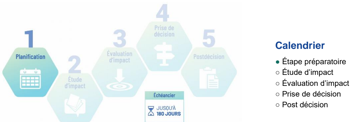
Figure 2 : Étape préparatoire dans le cadre du processus d'évaluation d'impact