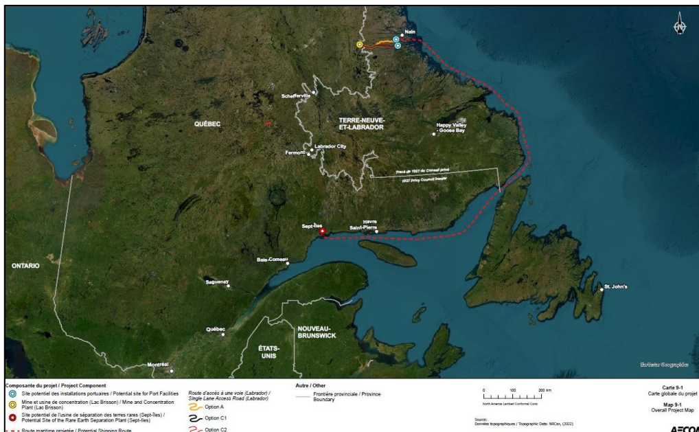
Figure 1 : Carte globale du projet

Torngat Metals Ltd. propose la construction, l'exploitation, la désaffectation et la fermeture d'une mine de terres rares à ciel ouvert, située à environ 235 kilomètres au nord-est de Schefferville, au Québec. La capacité de production de la mine serait de maximum 36 000 tonnes par jour et la durée de vie serait de 30 ans. Tel qu'il est proposé, le projet comprendrait au site de la mine une piste d'atterrissage de 1 500 mètres, une usine de concentration de terres rares d'une capacité d'admission de minerai de 17 000 tonnes par jour, des haldes de stériles et de résidus, et des bâtiments connexes. Le projet comprendrait également une route d'environ 170 kilomètres entre le site de la mine et de nouvelles installations portuaires sur la côte du Labrador.