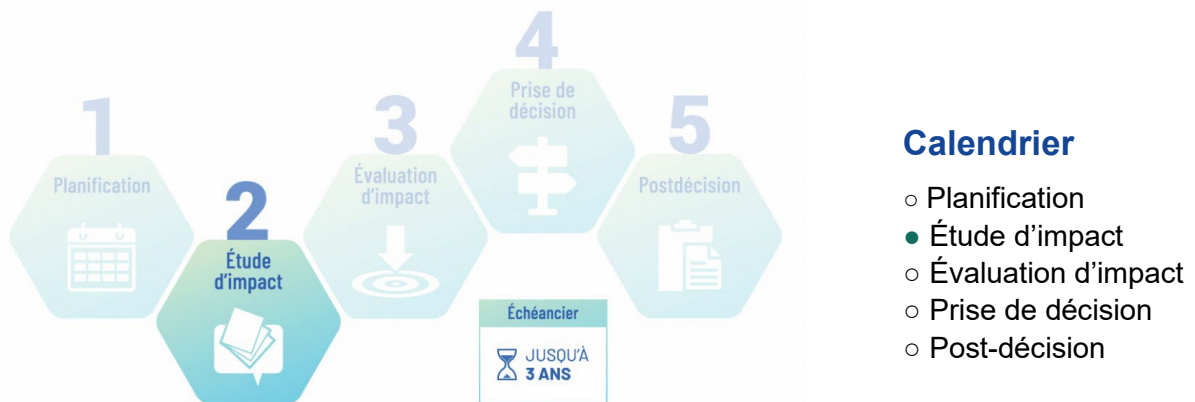
Figure 2 : Étape de l'étude d'impact dans le cadre du processus d'évaluation d'impact

Le 19 septembre 2025, le comité a émis l'Avis du début d'une évaluation d'impact pour le projet et a fourni au promoteur la version finale des lignes directrices individualisées relatives à l'étude d'impact. Ce jalon a marqué le début de l'étape de l'étude d'impact (figure 2), au cours de laquelle le promoteur recueillera des renseignements et mènera des études telles que décrites dans les LDI afin de préparer une étude d'impact.