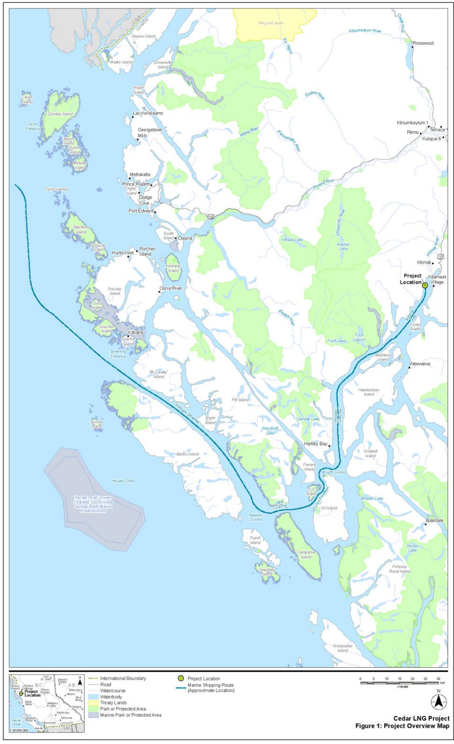
Figure 1 Carte d'aperçu du projet désigné