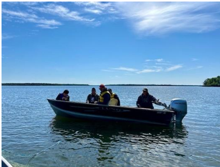
Photo 1: Photo prise lors du voyage de sensibilisation de la CCSN à Pinehouse (Saskatchewan) en 2024

Dans le cadre des procédures de la Commission, des décisions seront prises concernant l'évaluation environnementale (EE), la demande de permis de Denison, ainsi que sur le respect de l'obligation de consulter les Nations et communautés autochtones. Ces décisions seront rendues dans le cadre d'une audience publique de la Commission, qui comprendra des possibilités de participation pour les Nations et communautés autochtones ainsi que pour le public.