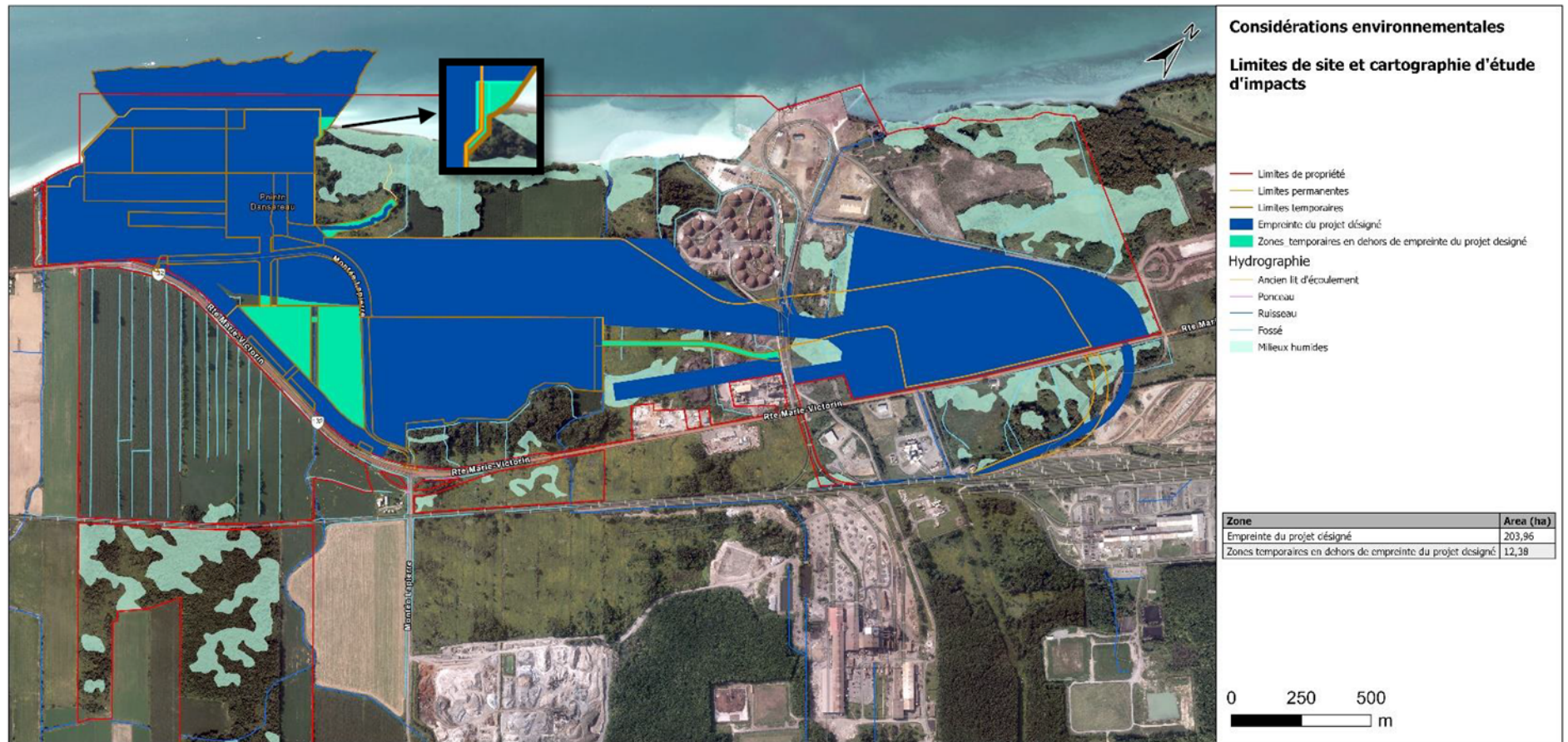
Figure 2 : Limites de site et cartographie d'étude d'impacts