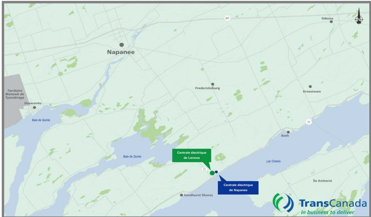
Illustration 3 Centrale électrique de Napanee et centrale électrique de Lennox adjacente