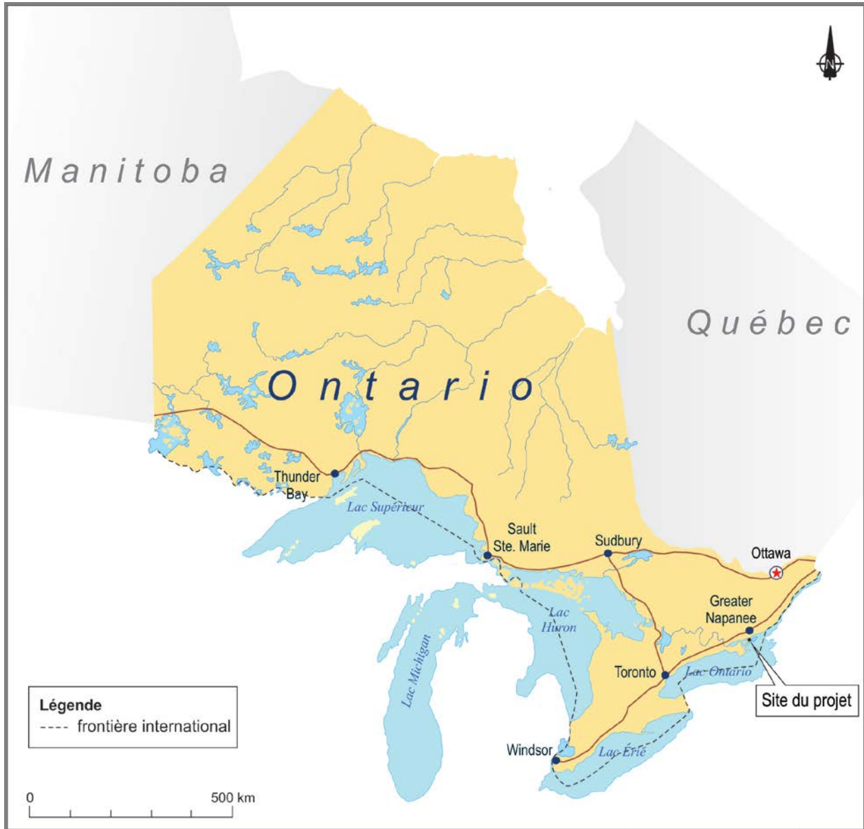
Illustration 1 Localisation du projet