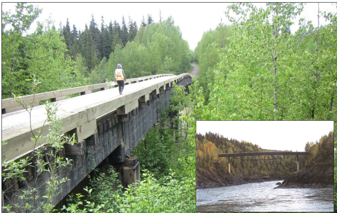
Figure 2-1 Photo du pont de la rivière Nass, orientation est (en médaillon: orientation sud)

Des inspections de proximité immédiate réalisées récemment par le MFTRN de la C.-B. ont mis en évidence de la pourriture dans la structure. Le MFTRN de la C.-B. a donc décidé de réduire la capacité portante du pont et a déterminé qu'il serait nécessaire de le remplacer s'il devait être utilisé par le promoteur pour transporter les charges industrielles liées à toutes les phases du projet minier Kitsault.